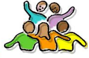
V I E R I N G