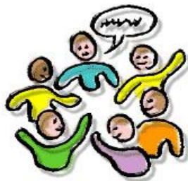
G E S P R E K