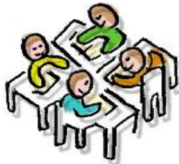
W E R K