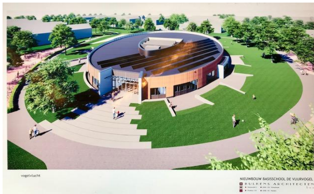
'De Vuurvogel in vogelvlucht'