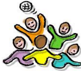
S P E L